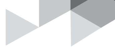
Table of contents